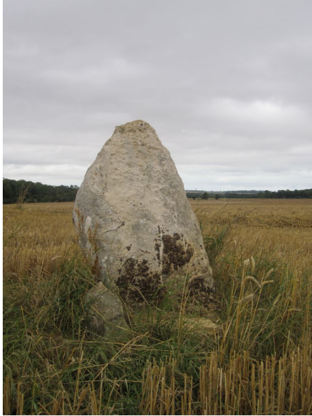
Bény-sur-Mer – Menhir, dit de la Demoiselle de Bracqueville Néolithique Classé Monument Historique en 1933