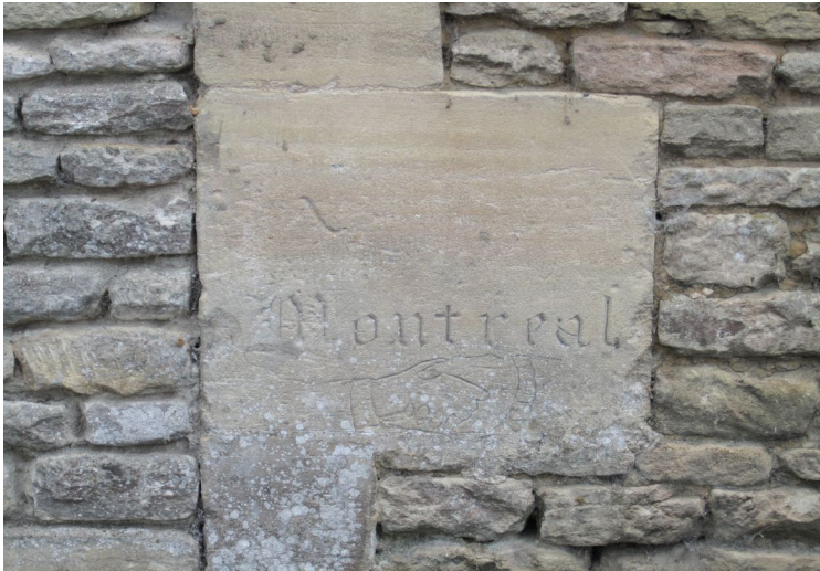
Amblie – Graffiti Route de Reviers 1944