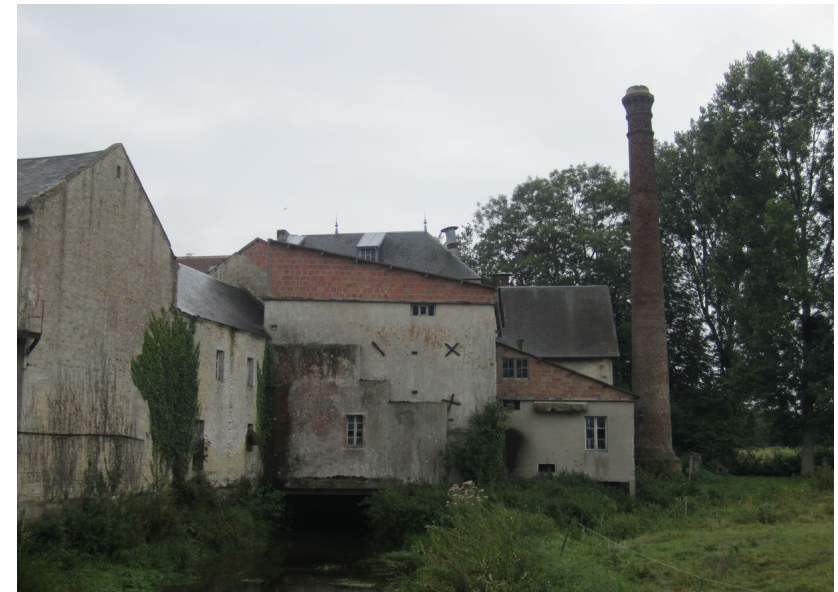
Saint-Gabriel-Brécy – Minoterie 21 rue du Moulin XIe (détruit) – XIXe et XXe siècles Activité suspendue en 1975