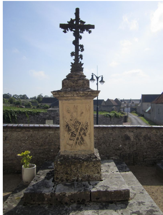
Tierceville – Croix de cimetière Avant 1863 Iconographie de la passion