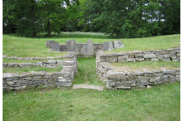
Colombiers-sur-Seulles Tumulus Néolithique