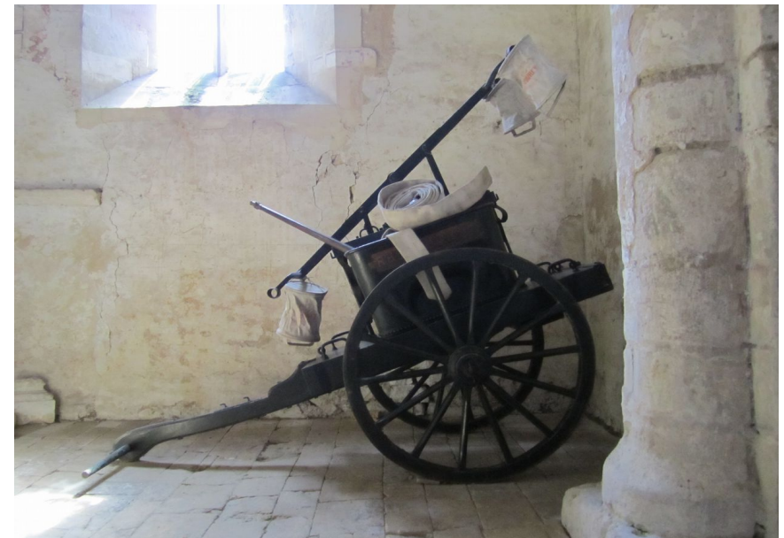
Rucqueville – Pompe à incendie Début du XXe siècle A.Thirron Fils & Successeurs