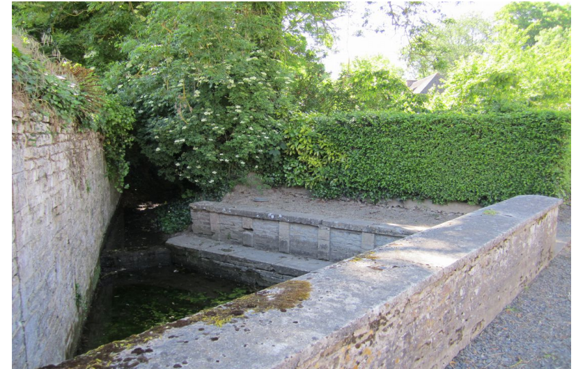
Lantheuil – Lavoir Rue du Douet de la Gronde Sur la Gronde