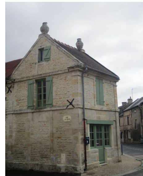
Reviers – Ancienne gare Grande Rue XXe siècle