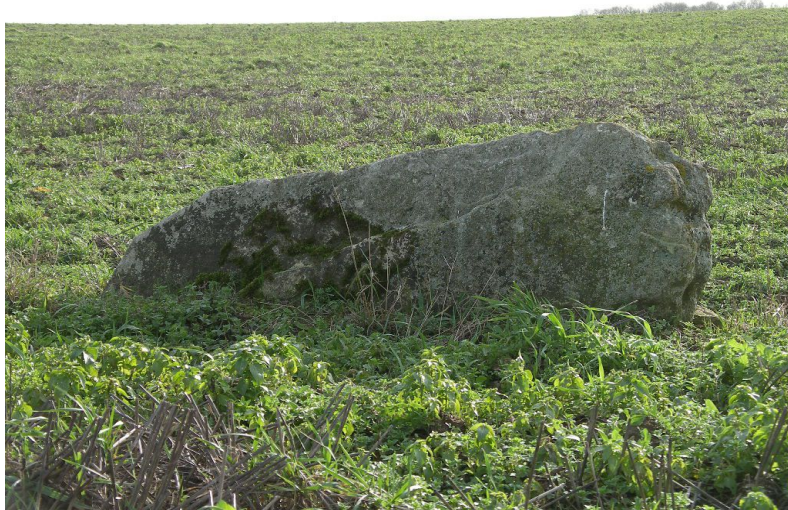
Reviers – Menhir, dit Pierre Debout Néolithique Classé Monument Historique en 1934