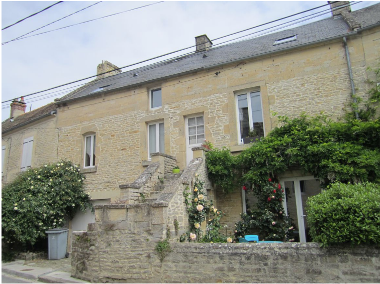
Colombiers-sur-Seulles – Maison de dentellière Rue du Bout de Bas XVIIIe siècle