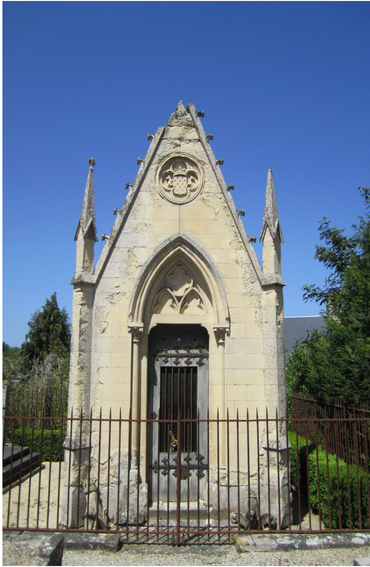
Lantheuil – Tombeau de la famille Turgot XIXe siècle (?)

Lantheuil (cimetière de Pierrepont) – Tombeau avec sculpture de la Vierge pleurant le Christ