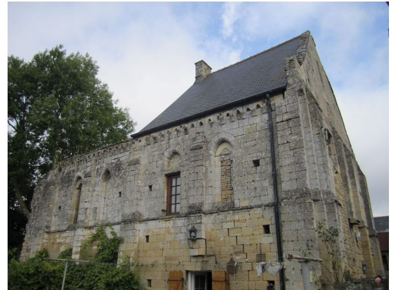
Reviers Chapelle Sainte Christine XIIe – XIIIe siècle Inscrite au Monument Historique en 1927