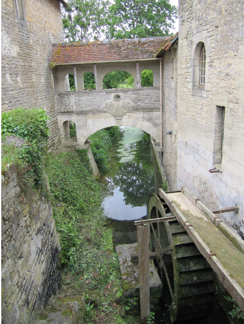
Cully – Moulin à foulon Le Grand Vey 1777 Utilisé jusqu'en 1957