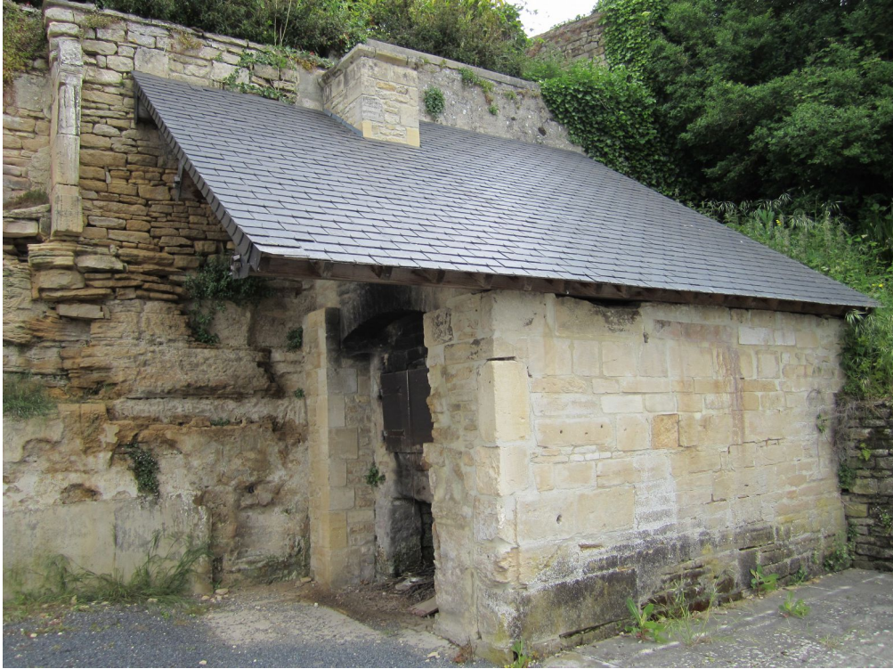
Colombiers-sur-Seulles – Four à pain XVIIIe siècle Rénové en 1996