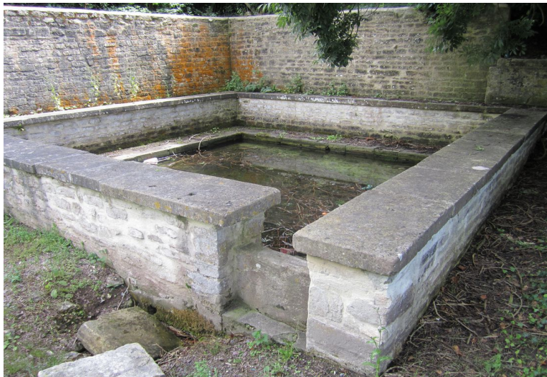
Coulombs – Lavoir Rue de la fontaine Alimenté par une source issue de la Gronde