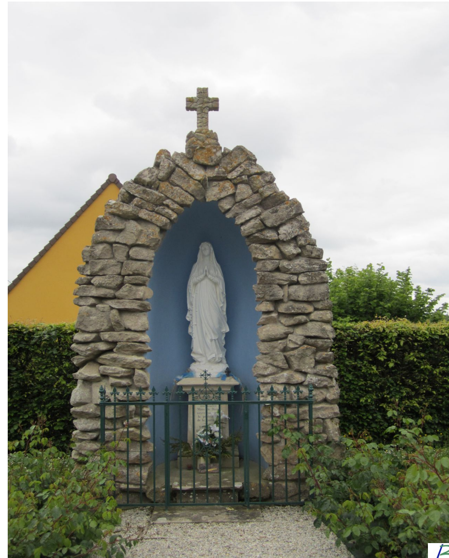
Fontaine-Henry – Chapelle de Moulineaux Rue Saint Clair XIIe-XVe-XVIIe siècles