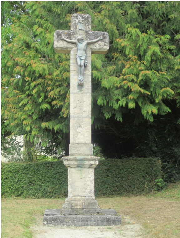
Coulombs – Calvaire Rue de l'église XIXe – XXe siècle