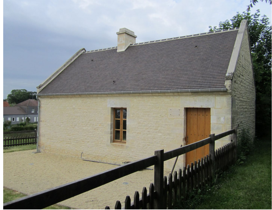
Villiers-le-sec – Four à pain XVIIe siècle Restauré en 2008