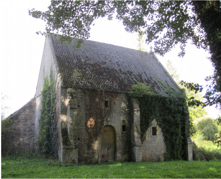
Amblie – Pressoir du château de Bonvouloir XVe siècle