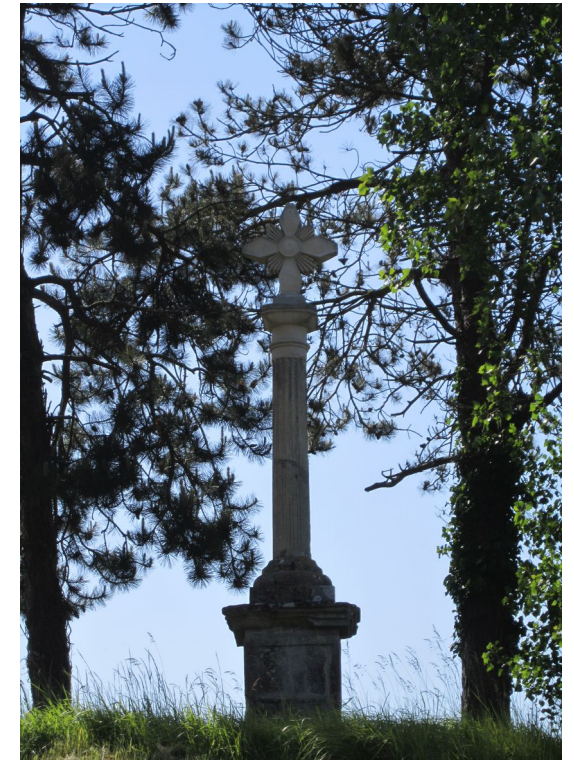
Lantheuil – Croix de Pierrepont Intersection D22 et Route de Caen XIXe siècle